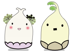
うど花ちゃん うどっ穂くん 立川商工会議所うどキャラクター

うどは地下の「むろ」の中で、 日光を当てないようにして育 てる特別な野菜です。うどが 白いのはそのためです。